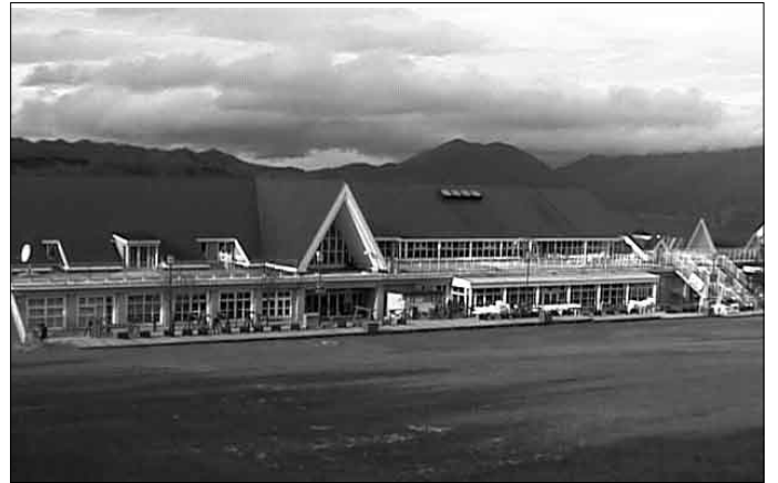
雄大な自然の中に建つ研修会場

新会場は栃木県那須郡『ハンターマウンテン塩原』。御存じの方も多いかと思いますが、ここはスキー場として有名なところ。標高1,200mの自然豊かな高原リゾートです。70ヘクタールの広大なフィールドで思う存分ドラムを叩くことが出来そうですね。