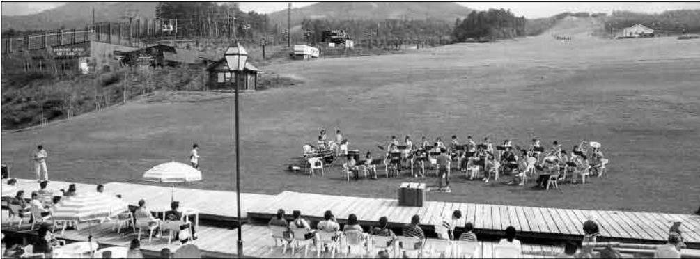
天気が良ければ屋外での演奏も出来るかも、